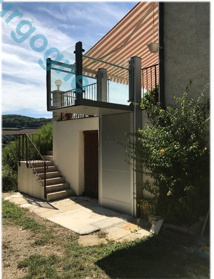
Plateforme stationnée en haut