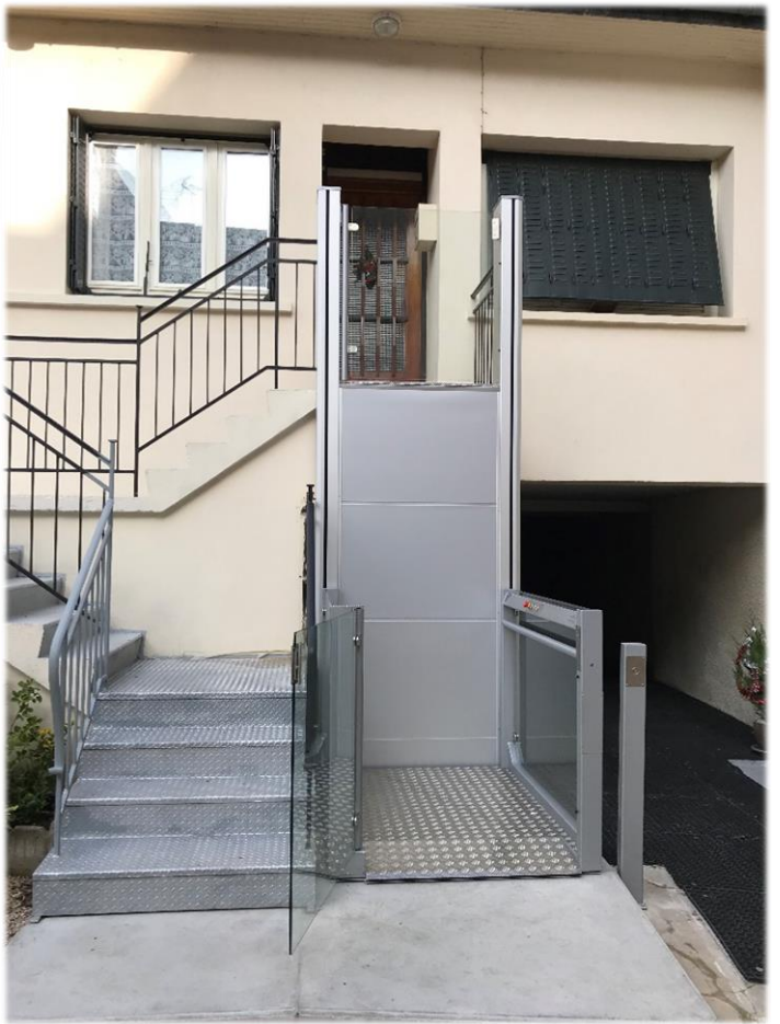
Plateforme stationnée en bas